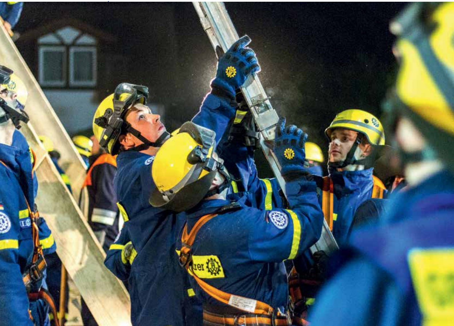
Das THW – kompetenter Partner im Katastrophenschutz.

Die nachfolgende Übersicht zeigt die Vielzahl unserer Einsatzmöglichkeiten bei unterschiedlichen Gefahrenlagen auf. Detaillierte Informationen dazu bietet der Katalog der Einsatzoptionen, den das THW ebenfalls herausgibt. ■