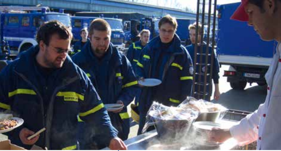
Die Teileinheit Verpflegung.