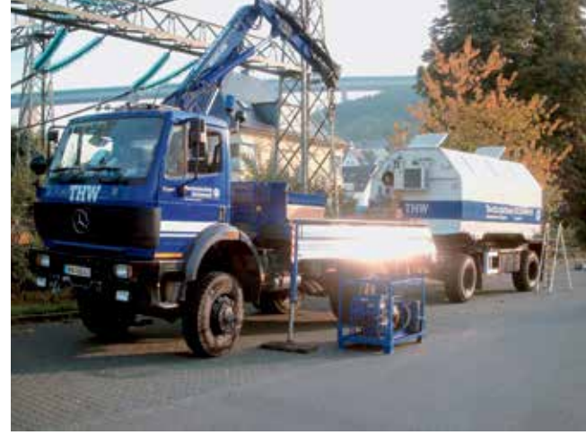
Die Teileinheit Materialerhaltung.